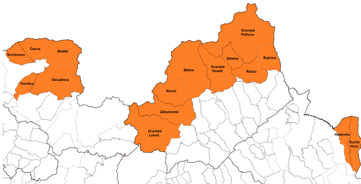
Mapa číslo 3: Goralské obce na Kysuciach a na Orave.

Ďalšou novinkou je fakt, že sčítanie sa vyplňa prevažne online formou, t.j. respondent si doma na počítači otvorí dokument, ktorý následne vyplní. Ak respondent z nejakého dôvodu nevie alebo nechce vyplniť dokument týmto spôsobom, tak pomoc pri vyplnení poskytnú asistenti, ktorí sa budú nachádzať v priestoroch obecného úradu. V prípade ak respondent nie je schopný alebo ochotný prísť na úrad, asistent ho navštívi priamo doma. Termín na vyplnenie dotazníkov je od 15. februára 2021 do 31. marca 2021.